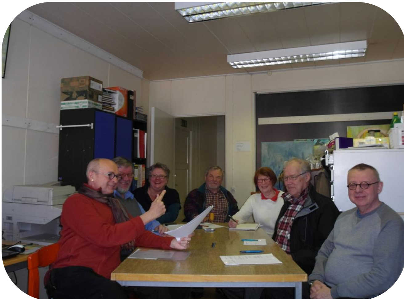
Hallituksen jäsenet / Styrelsens medlemmar